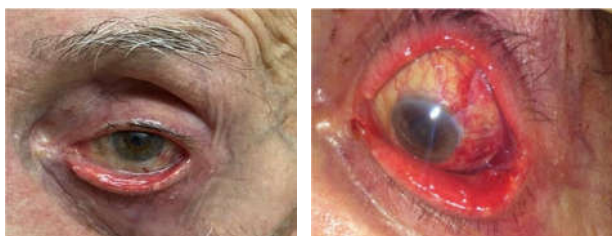
تصویر ۲- الف- یک روز بعد از جراحی و گذاشتن پیوند پرده آمنیوتیک. ب- تصویر یک ماه پس از جراحی

در معاینات صورت و بدن، ضایعه‌ای مشابه وجود نداشت. بیمار ارگانومگالی و لنفادنوپاتی نداشت. حرکات چشم طبیعی بود در ارزیابی‌های پاراکلینیک، نتایج آزمایشگاهی در محدوده طبیعی بود، الکتروکاردیوگرافی و رادیوگرافی قفسه سینه طبیعی بودند. وی سابقه ای از سرطان حنجره با پرتودرمانی را در ۱۵ سال گذشته ذکر می‌کرد. ضایعه چشمی با تشخیص‌های اولیه نئوپلاسم اسکواموس سطح چشم (OSSN) و توده متاستاتیک ندولار و پدانتولار تحت بیهوشی عمومی به طور کامل خارج گردید. عمل جراحی توده صلبیه با خونریزی شدید همراه بود. توده به صورت سطحی به صلبیه نفوذ کرده بود ولی در نهایت با برداشتن لایه به لایه از سطح صلبیه به طور کامل جدا گردید. میتوماکسین با غلظت ۰/۰۲ درصد به مدت ۳ دقیقه در محل گذاشته شد و پس از شستشو با ۵۰ میلی‌لیتر محلول سالین بالانس (BSS)، پرده آمنیوتیک (AMT) به عنوان گرافت در محل نقص ملتحمه گذاشته شد (تصویر ۲ الف و ب).