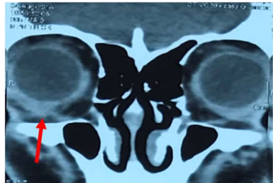
تصویر ۳- مقاطع قدامی‌تر از اربیت در CT اسکن بعد از عمل تغییر مسیر عضله اینفریور ابلیک راست و انحنای آن به سمت گلوب (فلش قرمز) و هم‌چنین افزایش ضخامت آن نسبت به سمت مقابل قابل را نشان می‌دهد.

شد. بیمار به مدت ۶ ماه پی‌گیری گردید و در طی این مدت تغییری در معاینات وی ایجاد نشد.