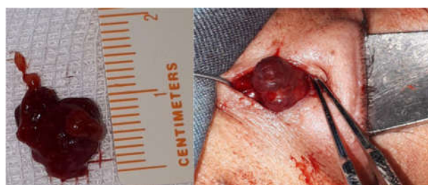
تصویر ۳- نمای ظاهری ضایعه: توده ارغوانی رنگ و لوبوله

با توجه به سطحی بودن توده، بررسی بیش‌تری انجام نشد و برای بیمار بیوپسی اکسیژنال از طریق برش پوستی روی ضایعه صورت گرفت. بافت نرم کنارزده (دایسکت) شد، توده توسط یک مالیبیل از پشت پلک به سمت قدام و نزدیک پوست هل داده شد و از بافت‌های اطراف با دایسکشن بلانت به خوبی جدا شد (تصویر ۳). توده ارغوانی رنگ لوبوله با حدود مشخص و بدون خونریزی خارج گردید، اندازه توده ۱/۳ × ۱/۲ سانتی‌متر بود و دارای دو لوب چسبیده به هم در جلو و یک لوب در عقب بود (تصویر ۳).