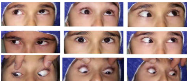
تصویر ۲- قبل از عمل دوم در چشم سمت راست بیمار. در نگاه به روبه‌رو در حالی که چشم سمت راست، فیکساتور می‌باشد، در چشم سمت چپ هایپرتروپی دیده می‌شود. در نگاه به سمت چپ و بالا بیش‌ترین محدودیت حرکت در چشم راست دیده می‌شود به گونه‌ای که در این جهت، چشم راست دارای هایپوتروپی می‌باشد.

نظر به به دوطرفه بودن سندرم براون در این بیمار و با توجه به براون اکتسابی، برای بیمار مشاوره روماتولوژی انجام شد. بررسی‌های سیستمیک جهت رد سندرم‌های روماتولوژی مانند آرتریت روماتوئید ایدیوپاتیک جوانان (JIA) صورت گرفت که نتایج آن منفی بود. برای بیمار جهت رد نمودن سینوزیت و بیماری‌های سینوسی، CT اسکن از اربیت و سینوس‌های پاراناژال انجام شد که